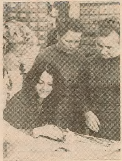
столкаван размяшчэнь матэрыяла А. А. Сінкевіч, Т. Л. Дудко, і, вразумела, рэдактар — Р. І. Ляховіч. Т. САХАШЧЫК.